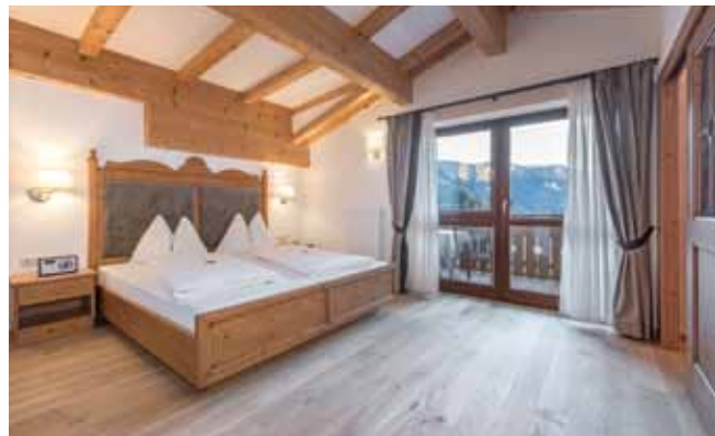
Suite nel Juché