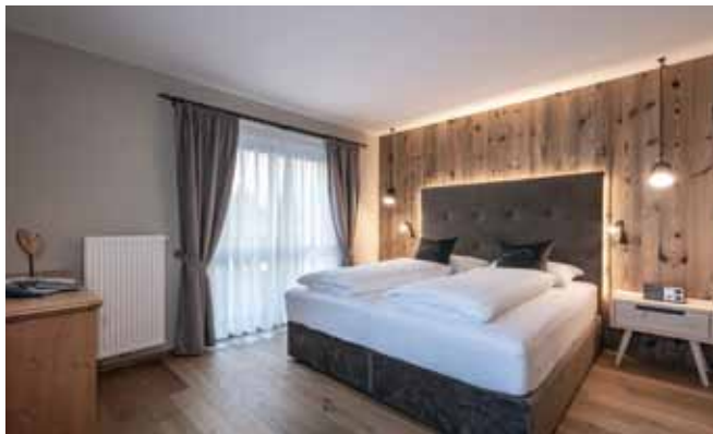
Suite nella torre