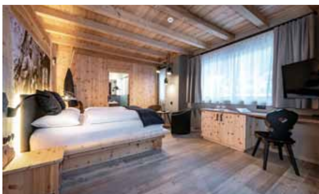
Suite Franz Schroffenegger